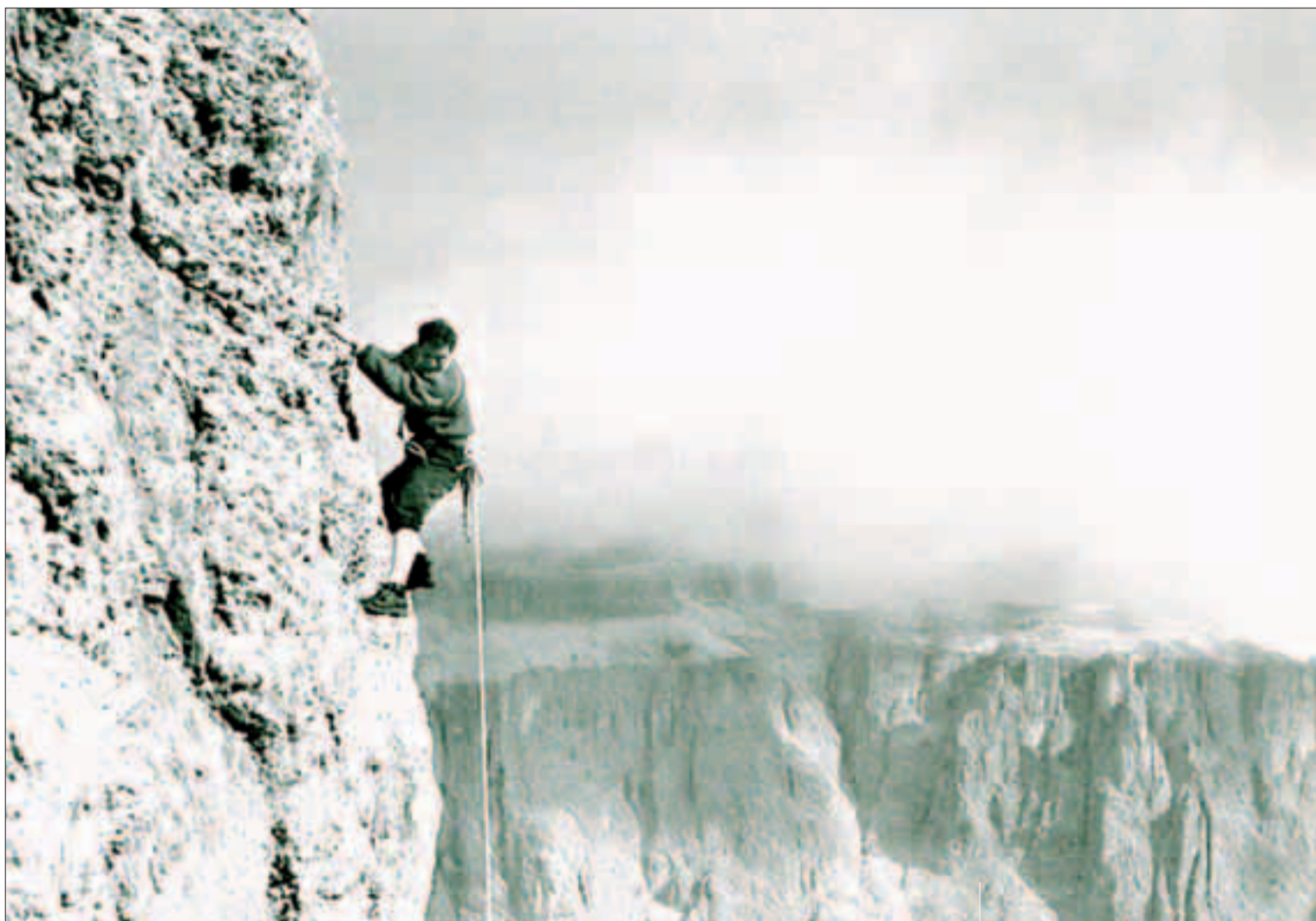
Cesare Maestri in parete: questa sera il celebre alpinista sarà fra i protagonisti del gran finale del Trento Filmfestival, che prevede anche un notevole momento musicale

U na festa, finalmente, per il «profeta» della montagna trentina, Cesare Maestri , che il 2 ottobre compie 81 anni, di cui 60 trascorsi in montagna, da guida alpina. Finalmente un tributo dal Trento Filmfestival: senza polemiche e senza Messner... «Come scusa? Non ho sentito bene»,